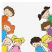
Idiomas y educación